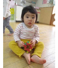
♪な～みだ君 さよなら さよ～なら なみだ君