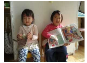
朝の準備がおわったら絵本タイム♪