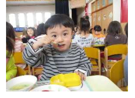
お給食もみんなで食べるとおいしいね！