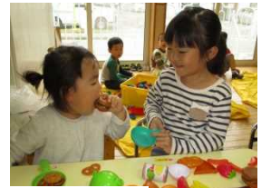
さくら組のお兄さんお姉さんやさしいな～