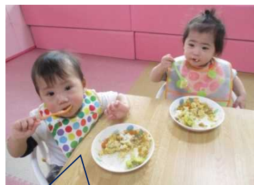
こもも組は自分でご飯を食べるよ！

あっという間に、進級、卒園まで残り3ヶ月となりました。身も心もぐんと大きくなった子どもたちです。今、それぞれのクラスで頑張っていることを紹介します！