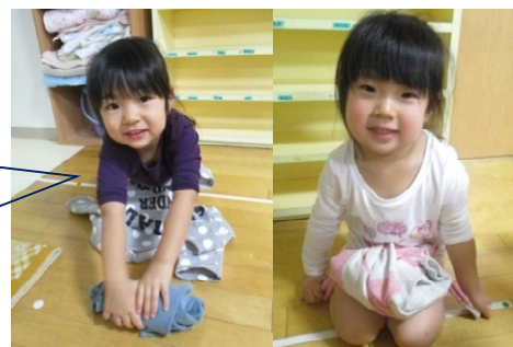
ちゅうりっぷ組は自分で脱いだ服を畳んで、袖を結ぶよ！