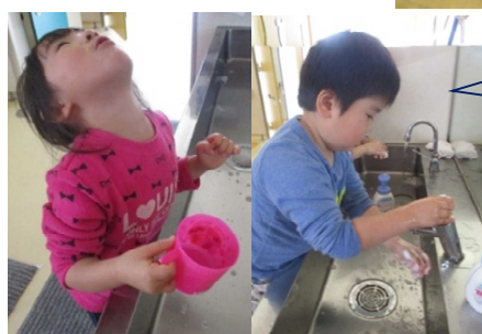
うめ組は風邪予防に手洗い・うがいをするよ！