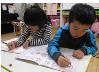
さくら組は正しい姿勢でワークの勉強中！