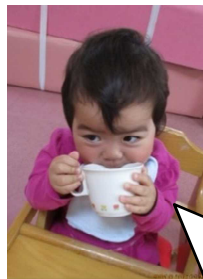
コップ上手に持てるよ♥

自立心とは・・・身近な環境に主体的に関わり様々な活動を楽しむ中で、しなければならぬことを自覚し、自分の力で行うために考えたり、工夫しながら、諦めずにやり遂げることで達成感を味わい、自信を持って行動できるようになること。