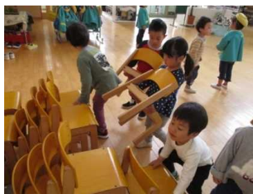
いすの片付け！重ねるの4こまで～！