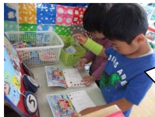
朝登園して来たら、今日の日付けに自分でハンコを押すよ！