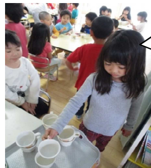
自分からすすんで片づけます♪