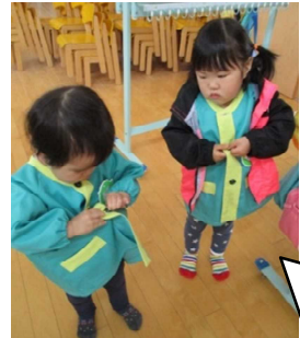
ボタンって指先の動きが大切★