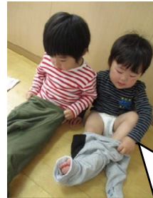
お着替え自分で頑張るよ☆