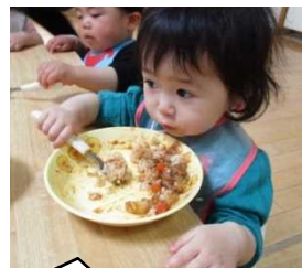
自分でスプーンをもって食べるよ☆